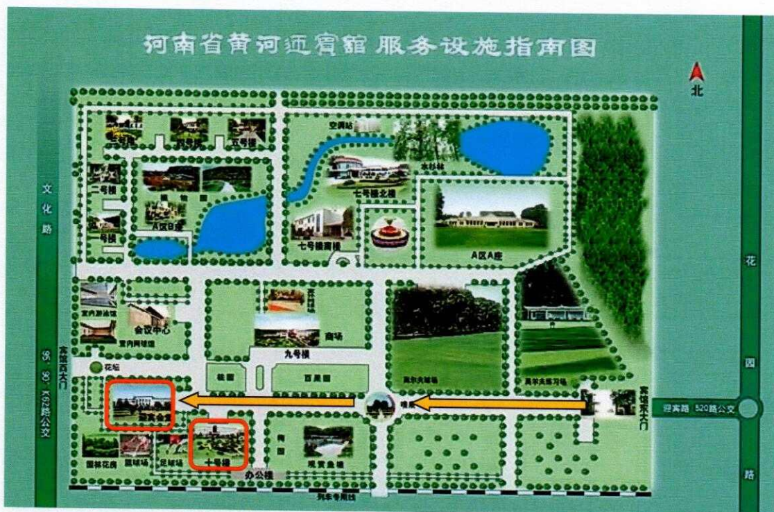
图1 河南省黄河迎宾馆服务设施指南图

1. 本次会议报到地点为郑州市黄河迎宾馆十号楼一层大厅，会场在迎宾会堂中二会议室。